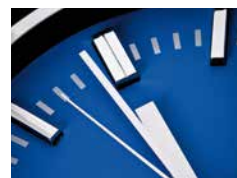
Service rund um die Uhr