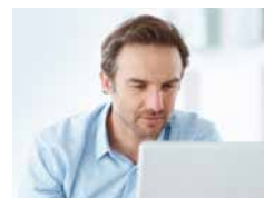
Administration und Überwachung in Echtzeit