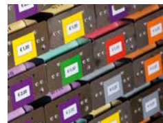
Flexibler Rollenmix – höchster Investi- tionsschutz